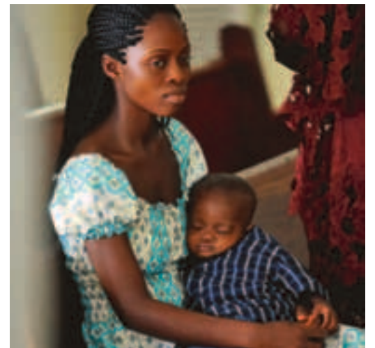
Delagare i gudstjänst i S:t Peters lutherska kyrka i Monrovia, Liberia.

Den första advent startade Svenska kyrkan sin julkampanj. I år ligger fokus på de miljoner barn som runtom i världen lever i ottrygghet. På flykt undan krig och förtryck, sökande efter rent vatten och mat för dagen. För många är våld en del av vardagen. Hela världen, Svenska kyrkans internationella arbete verkar för en tryggare värld. En värld utan fattigdom, hunger och förtryck. Kampanjen pågår till trettondagen och målet är att samla in 35 miljoner kronor. Nu behöver vi din hjälp att samla in pengar! Ge en gåva till julkampanjen via plusgiro 90 01 22-3, bankgiro 900-1223, sms:a HOPP till 72 950 och bidra med 50 kronor eller ge via www.svenskakyrkan.se/internationaltjobb eller i kollekten i kyrkan.